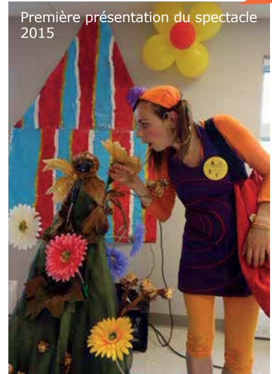
Première présentation du spectacle 2015