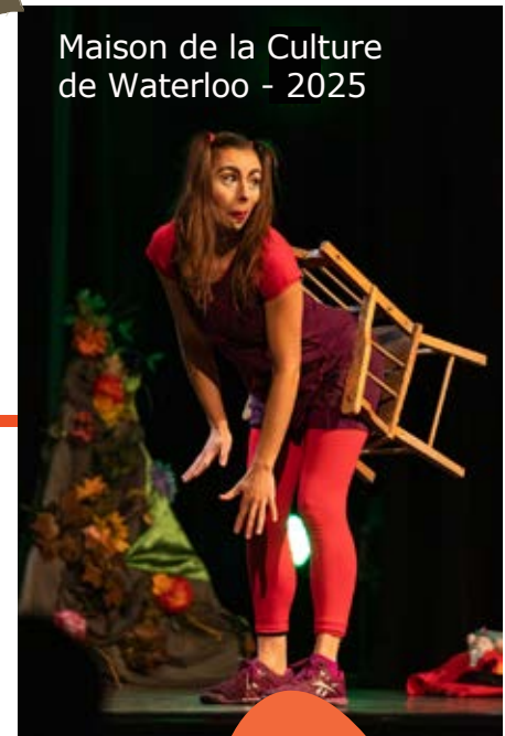
Maison de la Culture de Waterloo - 2025