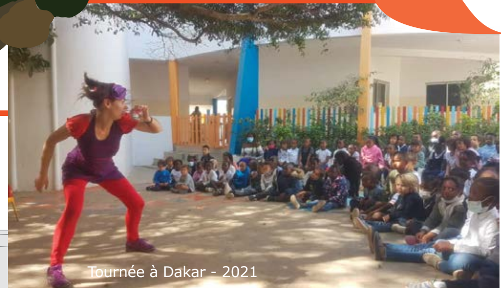
Tournée à Dakar - 2021